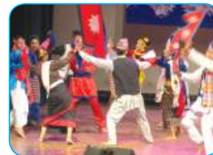
गणतान्त्रिक सांस्कृतिक साँभ