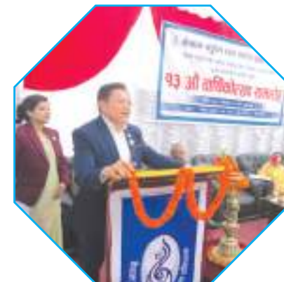
१३ औँ वार्षिकोत्सव