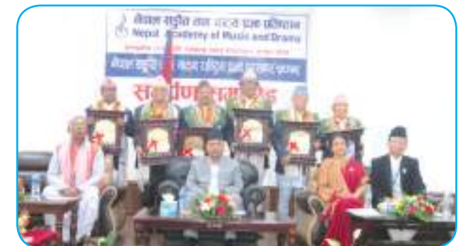
नेपाल सङ्गीत तथा नाट्य राष्ट्रिय प्रज्ञा पुरस्कार समर्पण