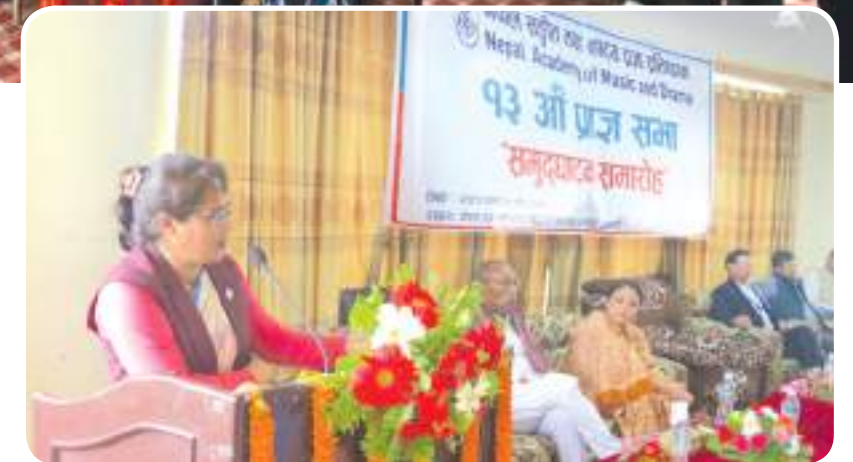
१३ औँ प्राज्ञ सभा